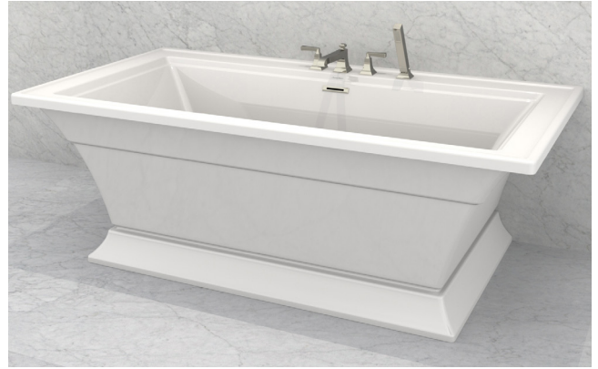
*Déverseur sur tablier et couvercle de trop-plein vendus séparément.

VOIR AU VERSO POUR LES DIMENSIONS D'INSTALLATION ET LES CARACTÉRISTIQUES DU PRODUIT